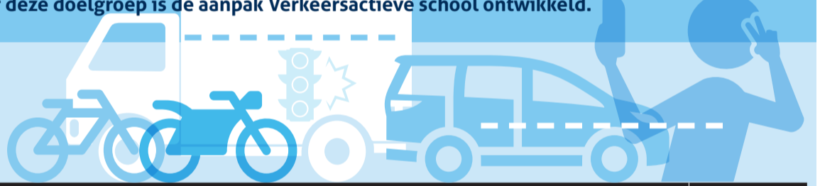
Percentage deelnemende Verkeersactieve scholen

Kinderen en jongeren van 4 - 17 jaar behoren tot de meest kwetsbare verkeersdeelnemers. Voor deze doelgroep is de aanpak Verkeersactieve school ontwikkeld.